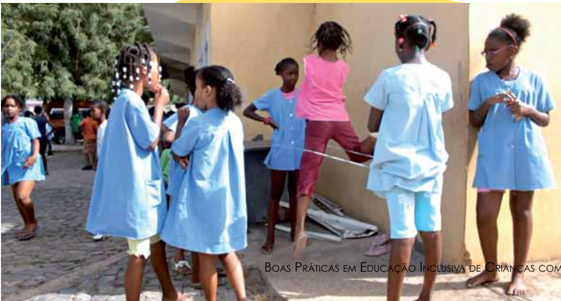
Crianças brincando na Escola Primária da Capelina na Praia, Ilha de Santiago, Cabo Verde